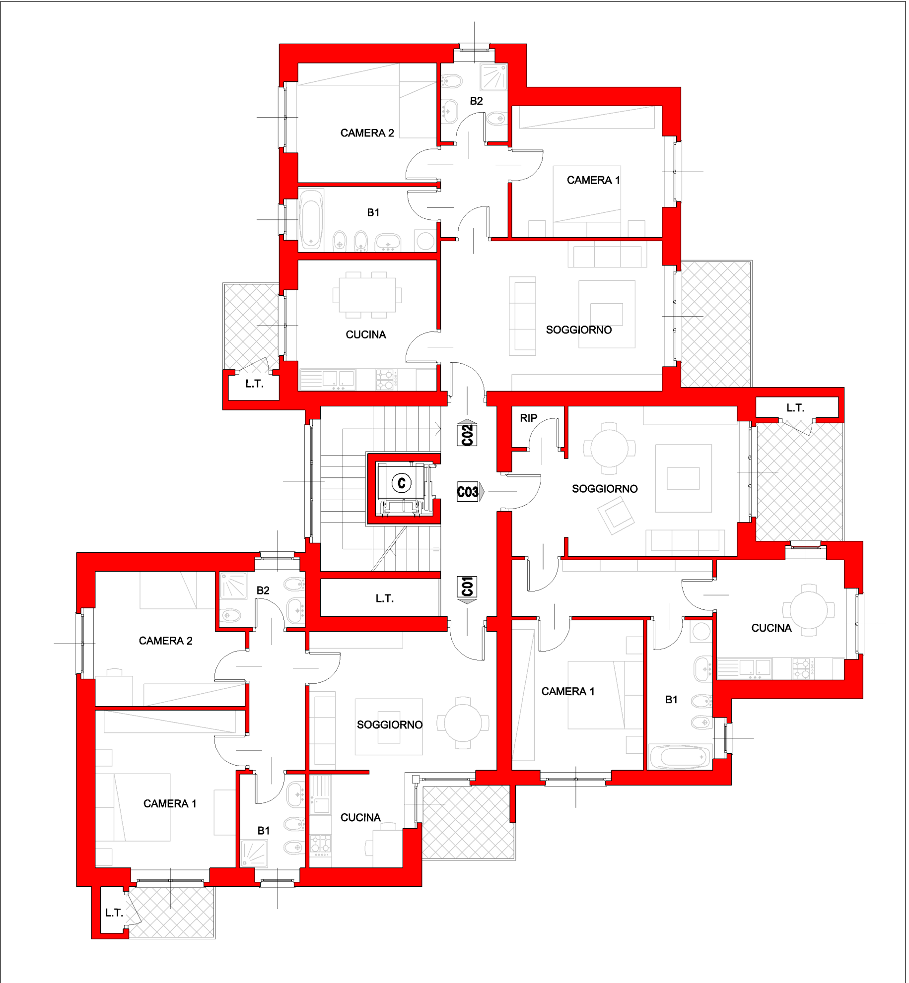
Soluzione progettuale indicativa per il piano tipo - Edifici a torre